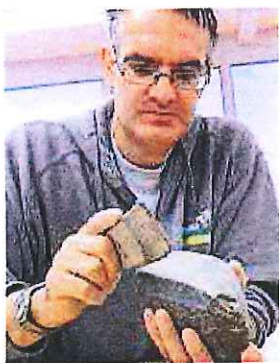
Ein Rohling mit Säge-Rinne.