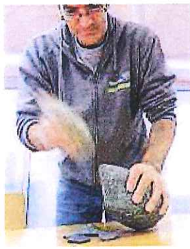
Den Rohling in Form klopfen.