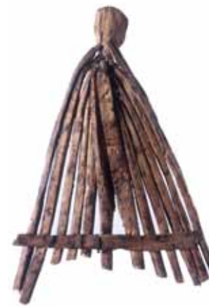
Rütchenkamm aus Holzstäbchen. Bleiche 3.