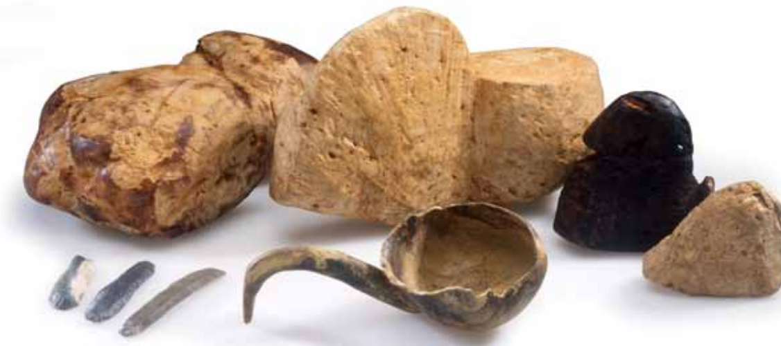
Verschiedene Stadien der Holztassenherstellung. Vorne das Endprodukt.