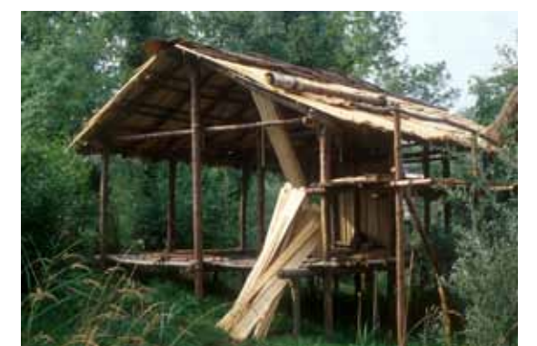
Arbon-Haus 1998 im Aufbau für das Pfahlbaumuseum in Unteruhldingen ( www.pfahlbauten.de ).