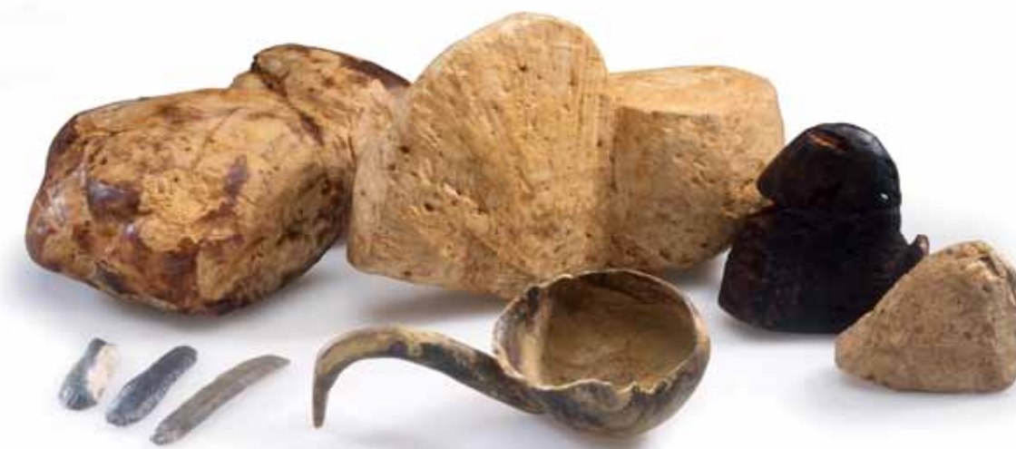
Verschiedene Stadien der Holzassenherstellung. Vorne das Endprodukt.