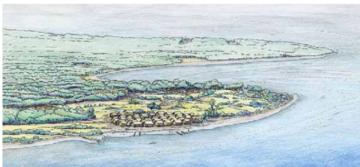
So könnte Arbon zur Steinzeit ausgesehen haben. Der Seespiegel war um 3380 v. Chr. einiges tiefer als heute.