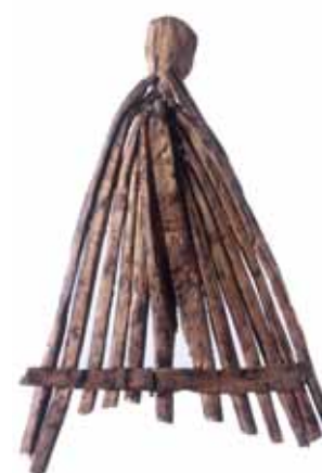
Rütchenkamm aus Holzstäbchen. Bleiche 3.