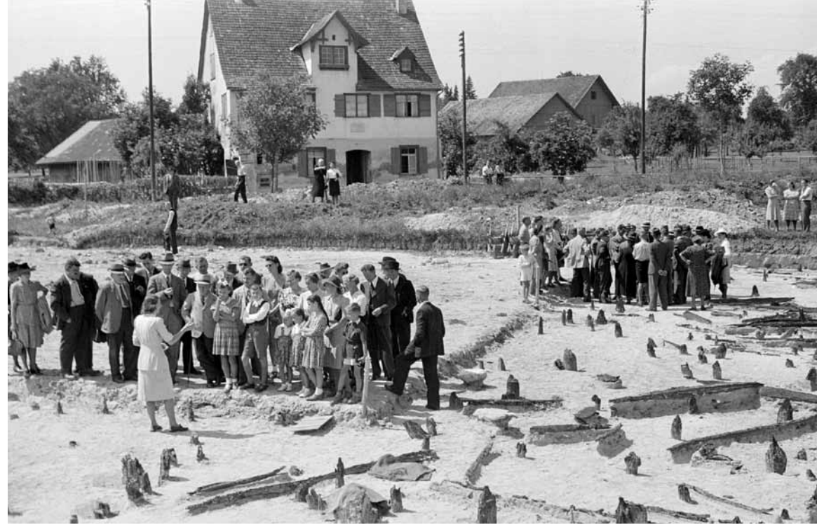
Führung Sommer 1945 auf der Grabung Bleiche 2. Im Hintergrund das noch nicht verschobene Mayrhaus.

Heute liegen die Fundschichten von mehreren Metern Sediment überdeckt unter dem Parkplatz und der Überbauung gut geschützt im feuchten Untergrund.