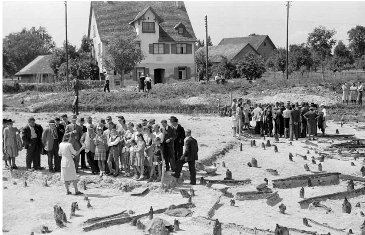
Führung Sommer 1945 auf der Grabung Bleiche 2. Im Hintergrund das noch nicht verschobene Mayrhaus.

Heute liegen die Fundschichten von mehreren Metern Sediment überdeckt unter dem Parkplatz und der Überbauung gut geschützt im feuchten Untergrund.