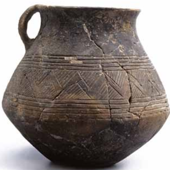
Frühbronzezeitliches Gefäss aus Bleiche 2.