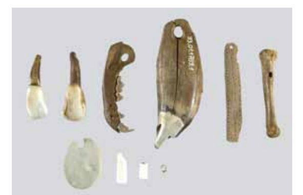
Schmuckanhänger aus Zahn, Knochen, Stein und Muschelschalen.